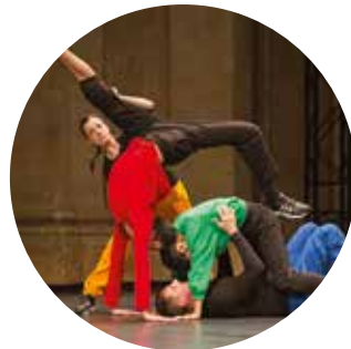
Tetris © Didier Philispart