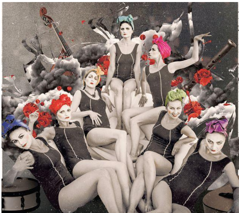
Terabak de Kyiv

Au plus près des spectateurs, attablés comme dans un cabaret populaire, un groupe d'artistes aux talents multiples, offrent tour à tour leurs performances sur une scène modulable. Mât chinois, trampoline, tours de magie où le spectateur est invité à participer, sangles, monocycle et acrobaties... Les actes s'enchaînent, tantôt graves tantôt burlesques.