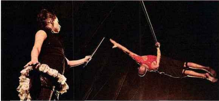
Les sorcières de Terabak de Kyiv instaurent une ambiance de cabaret envoûtante.