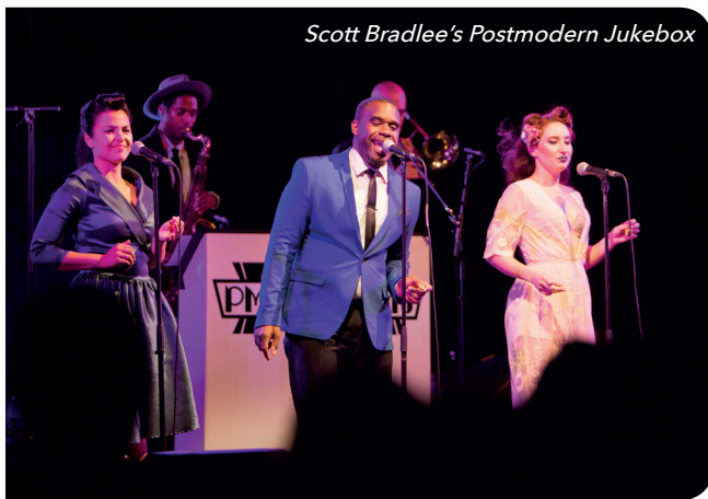
Scott Bradlee's Postmodern Jukebox