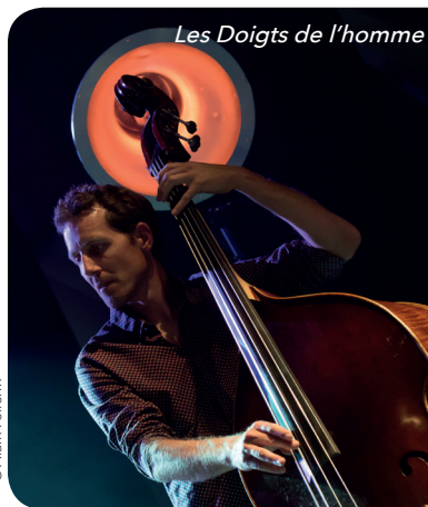
Les Doigts de l'homme